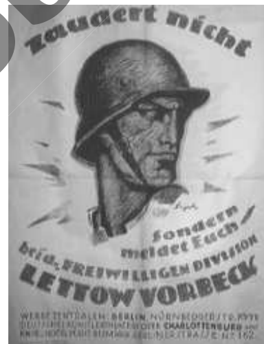
Werbung für das Freikorps Lettow-Vorbeck